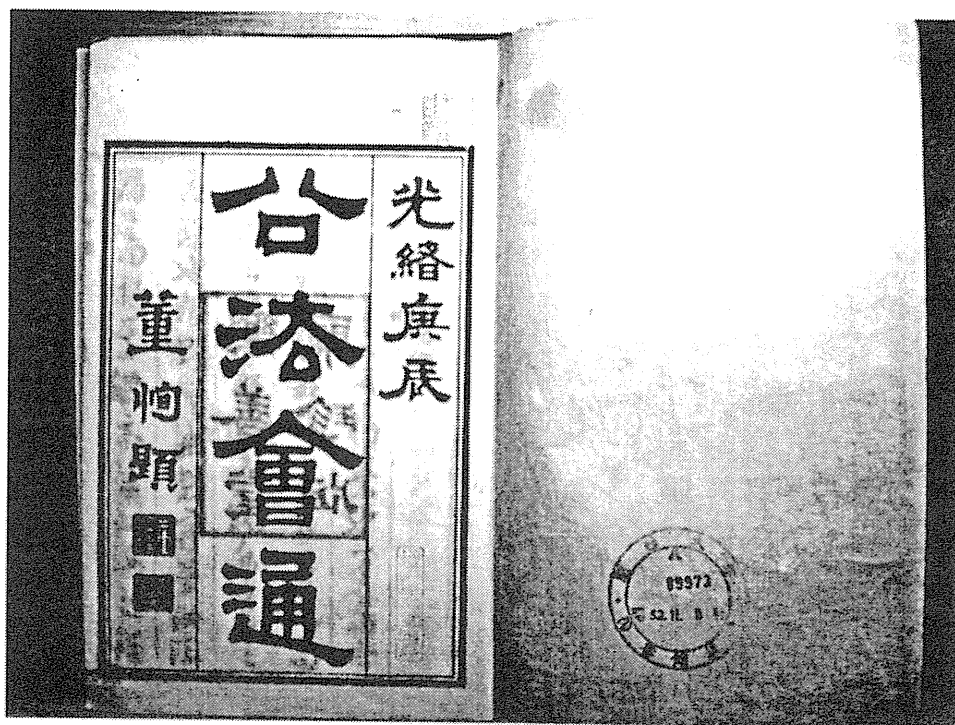
関西大学図書館増田涉文庫所蔵の漢訳洋書：『富国策』『公法会通』